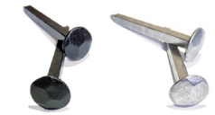
Clous martelés Hammered hanging nail Ø 14 mm — L : 40mm