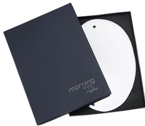
Chaque miroir est protégé par un écrin sur mesure, façonné à la main. Each mirror comes in it's own protective, handcrafted, prestation box.