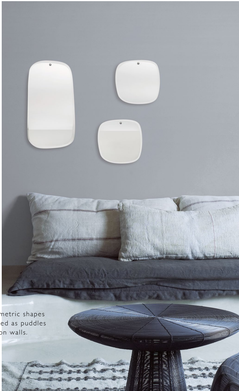
Asymmetric shapes dreamed as puddles on walls.