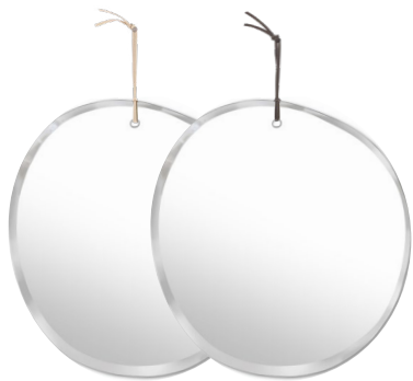
Lien en cuir de kangourou Naturel / Noir Kangaroo leather thonging Natural / Black

Hand-cut mirrors. 9 steps to create these asymmetrical shapes and irregular bevelled edges.